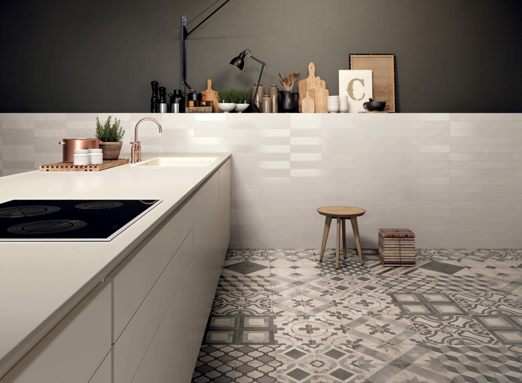
Terra 20 Decori Mix 20 × 20