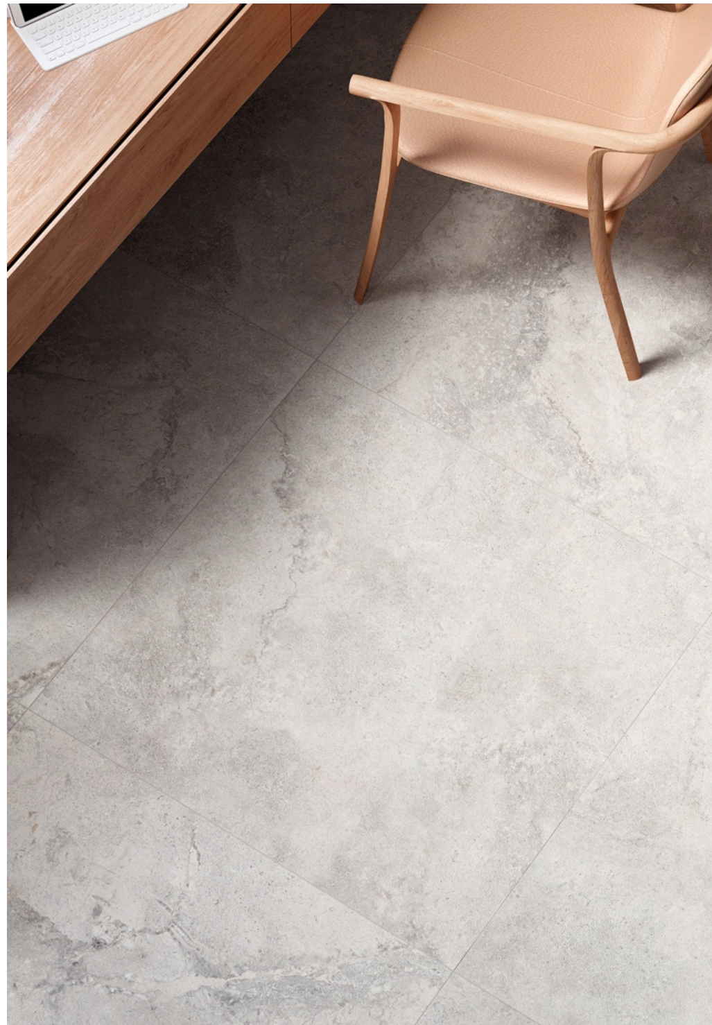
Valley Sale 75 × 150