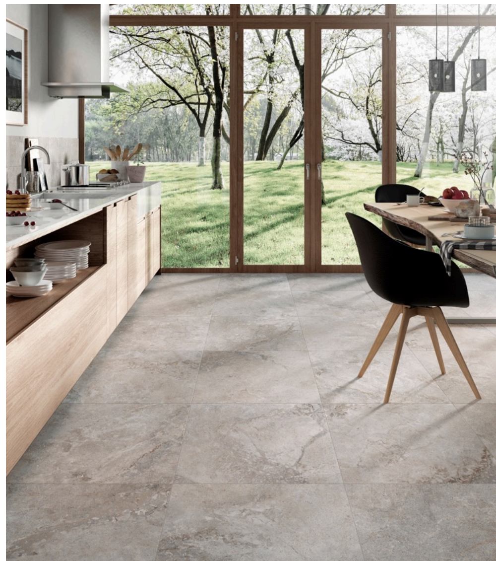
Valley Cenere 75 × 150