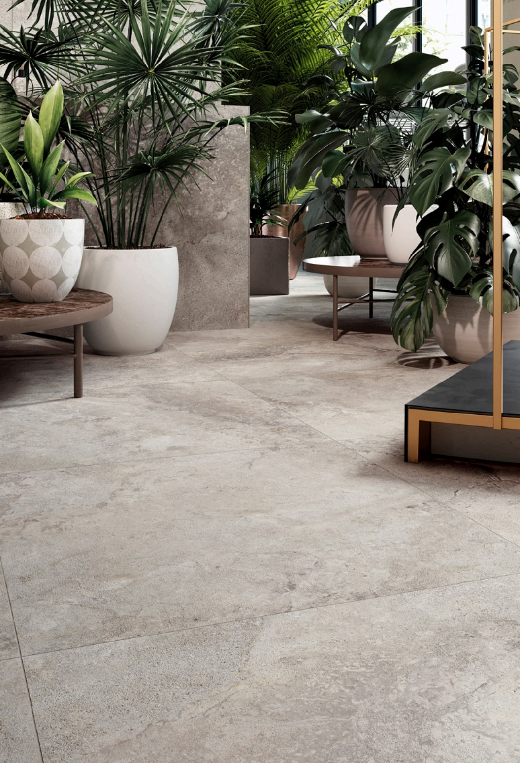
Valley Cenere 75 × 150