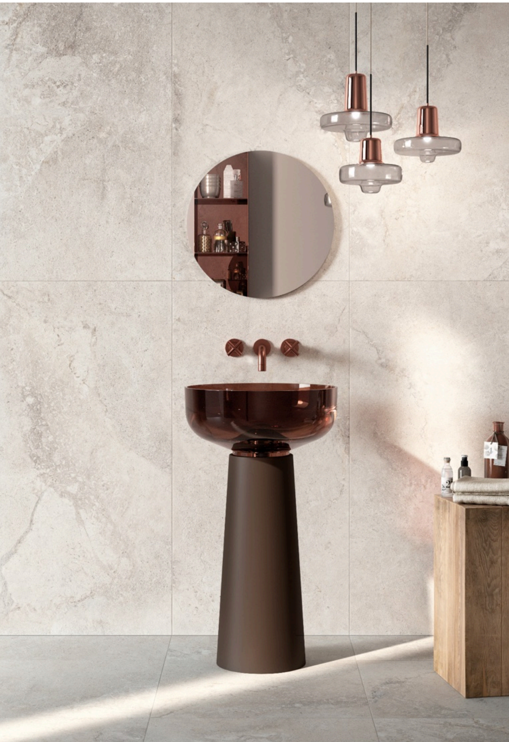
Valley Sale 75 × 150