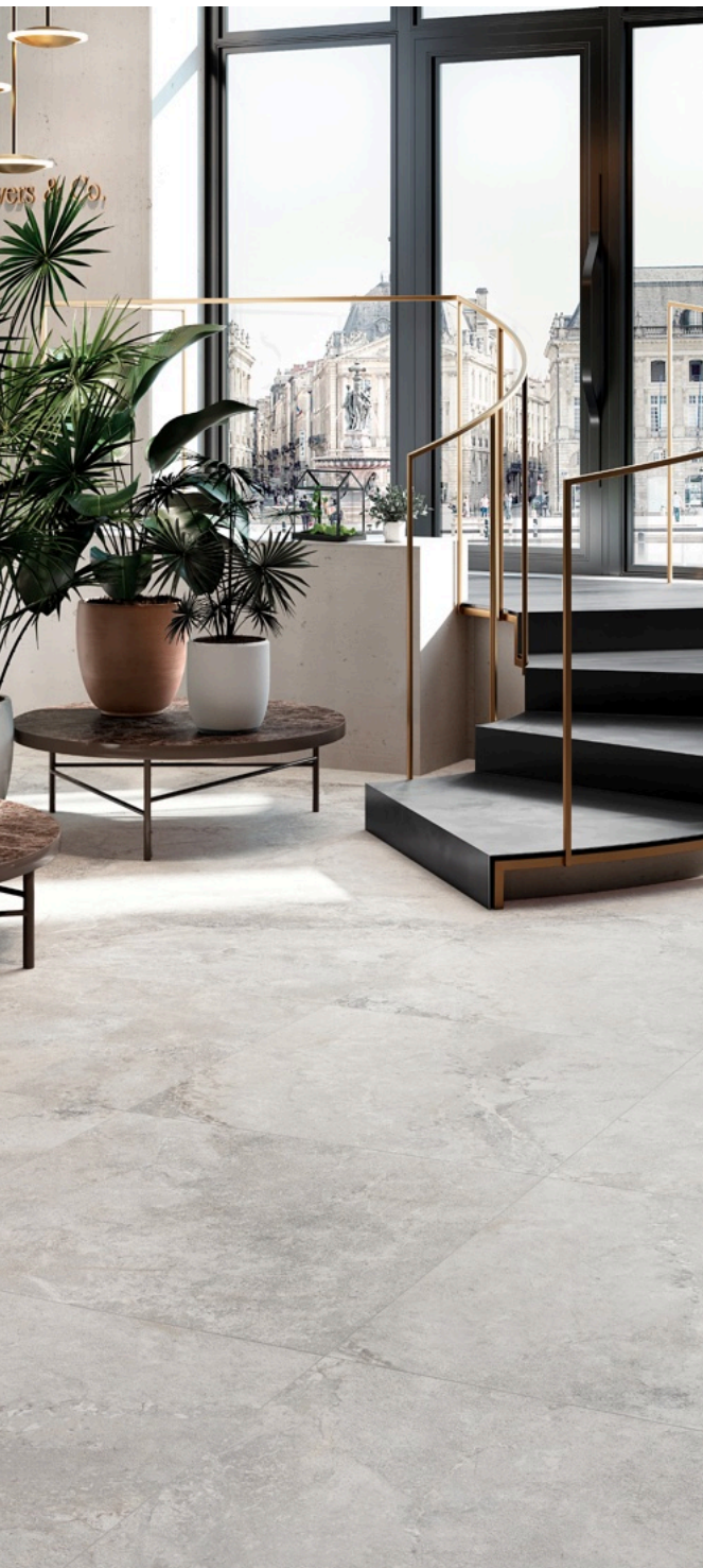
Valley Cenere 75 × 150