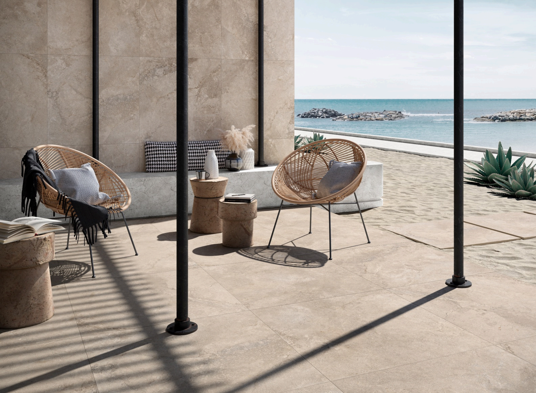
Valley Sabbia 75 × 150