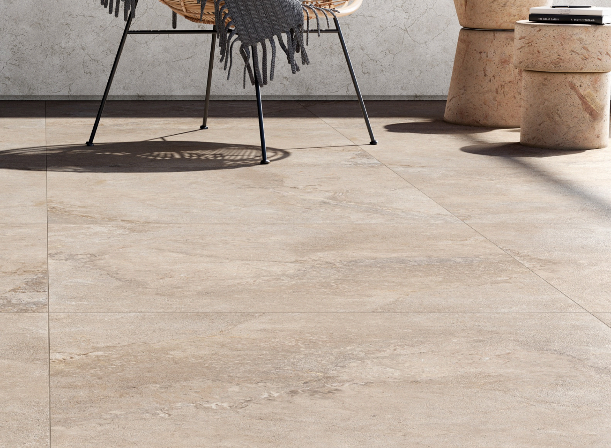
Valley Sabbia 75 × 150