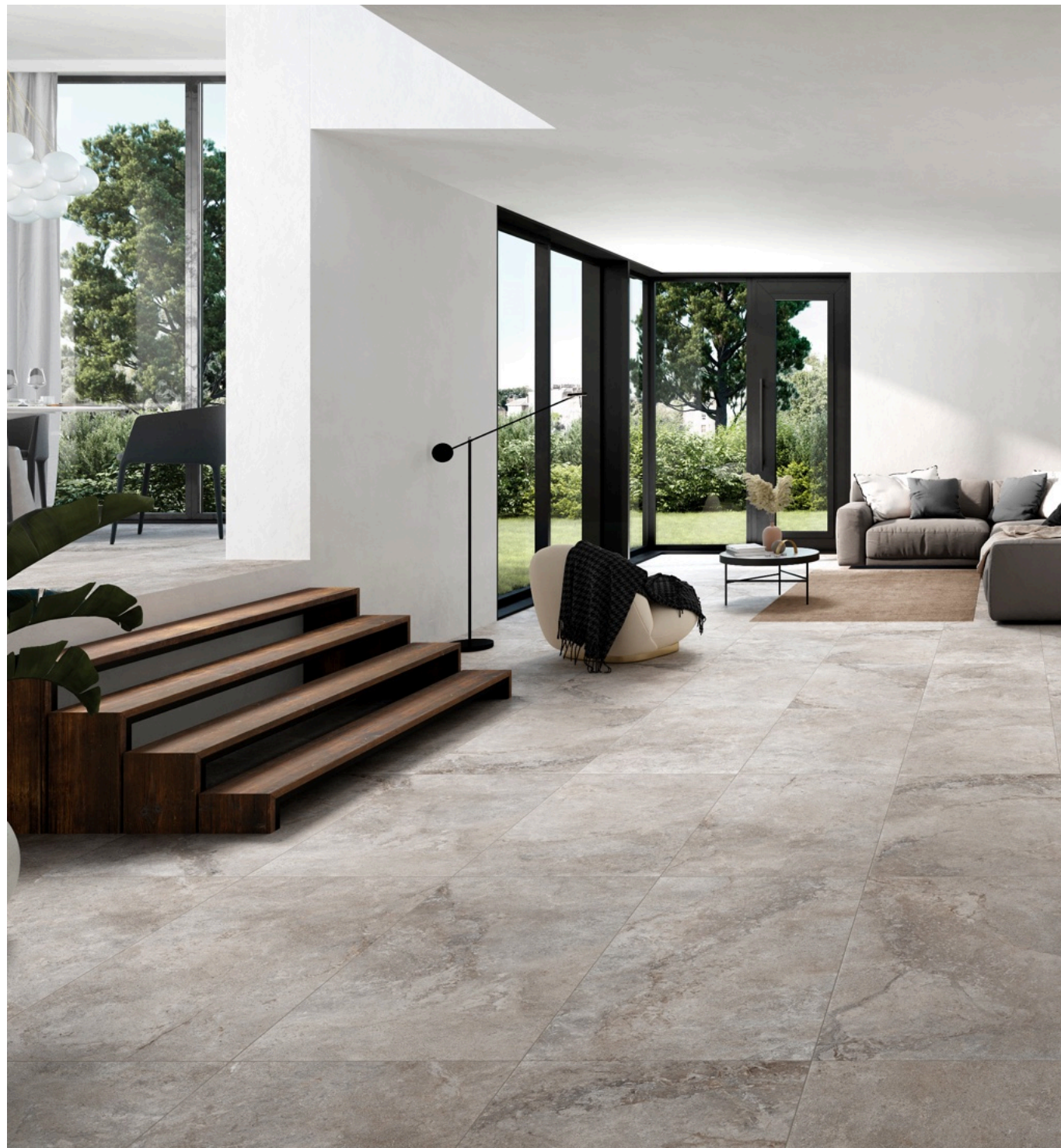
Valley Cenere 75 × 150