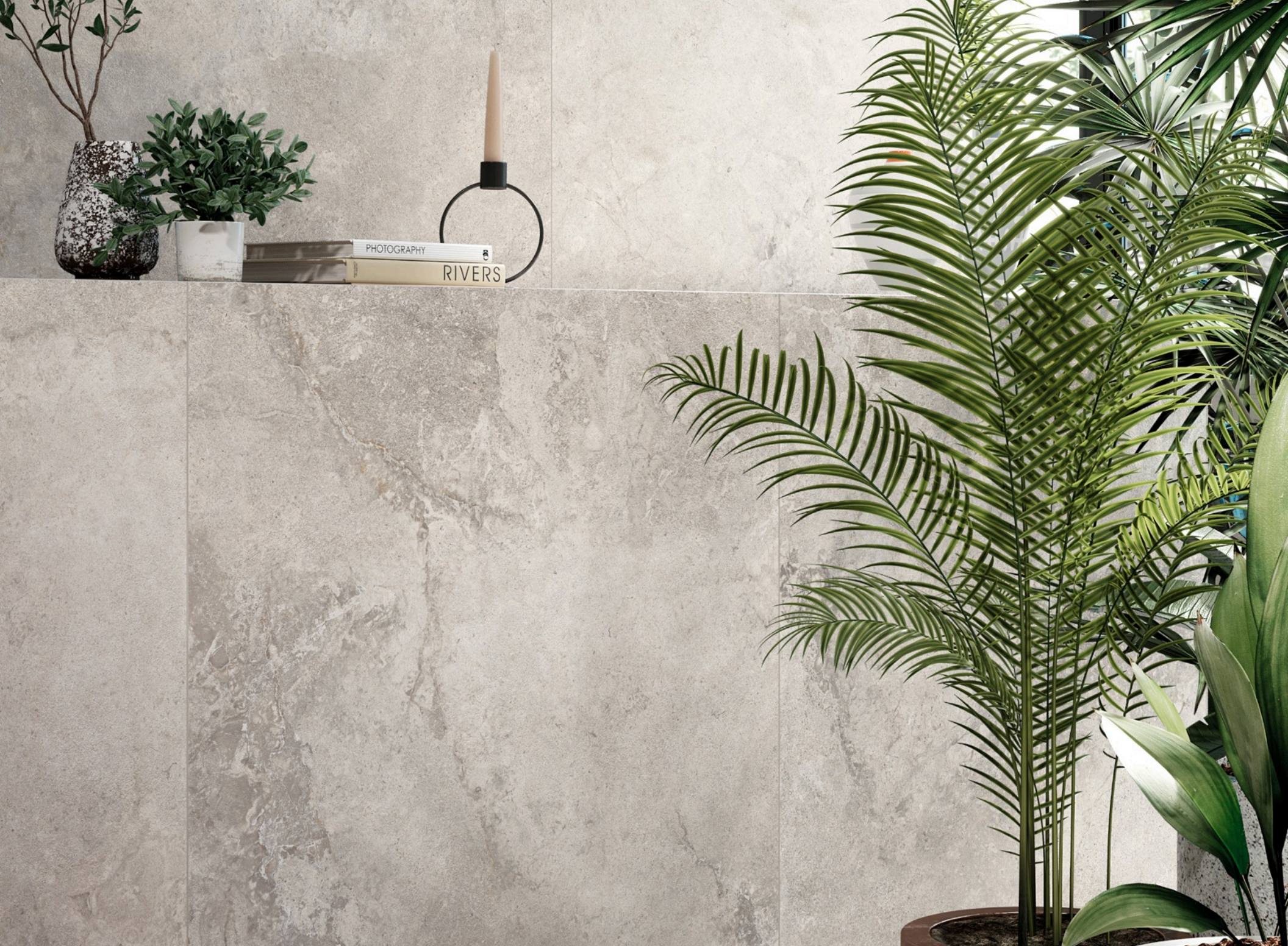
Valley Cenere 75 × 150