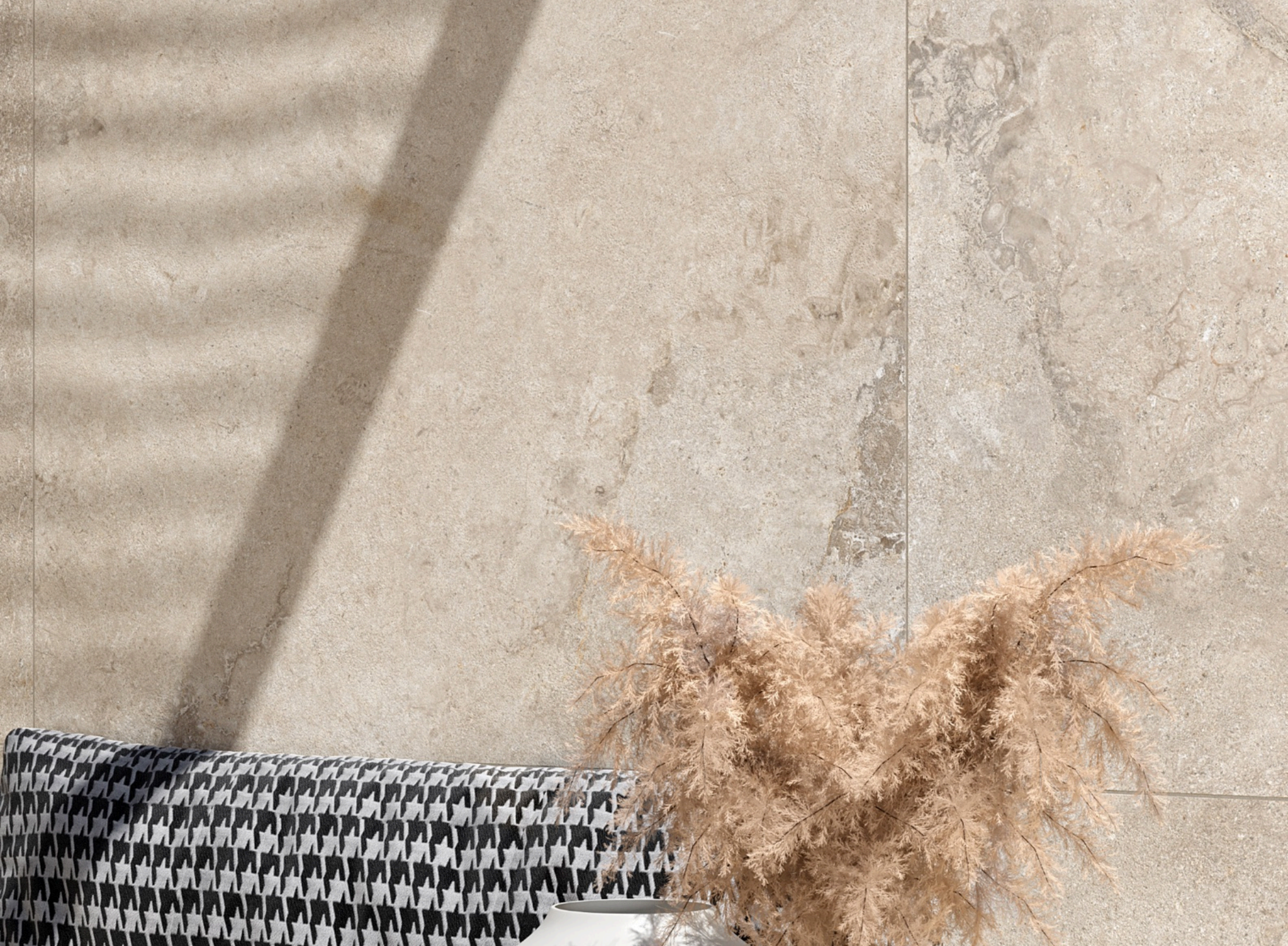
Valley Sabbia 75 × 150