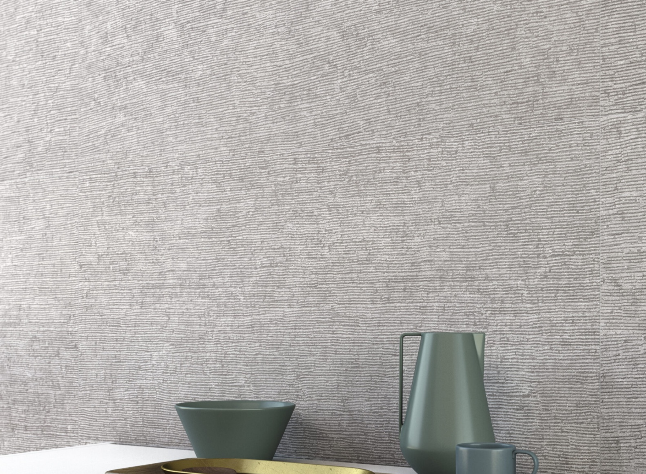
Stone Talk Rullata Grey 60 x 120