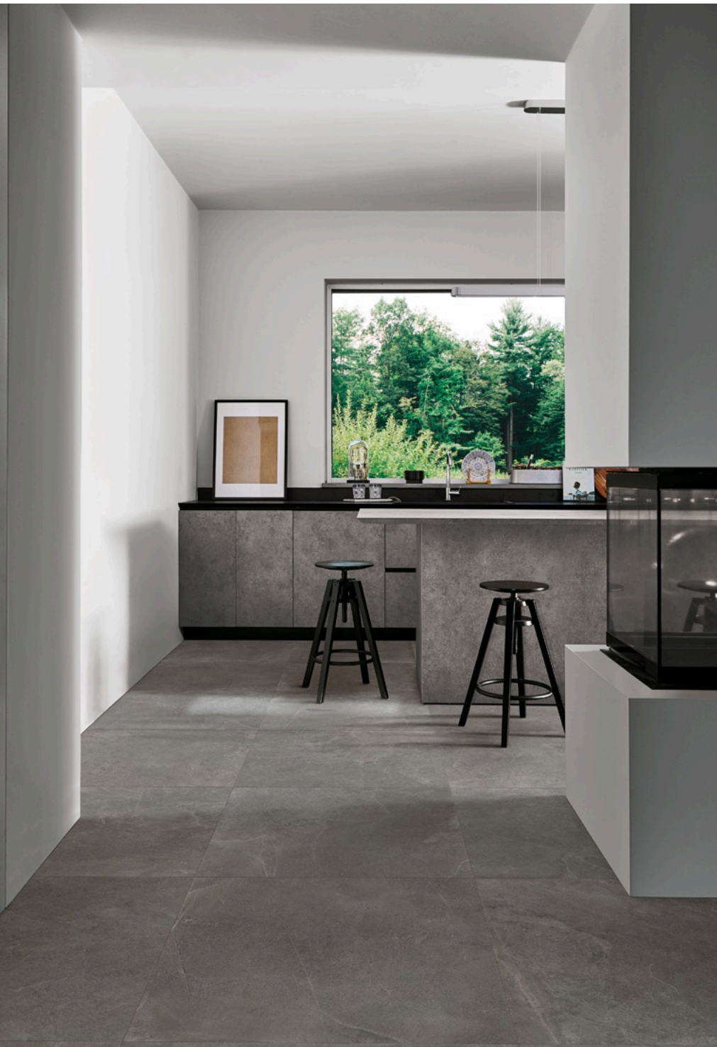
Realstone Slate Musk 75 × 150