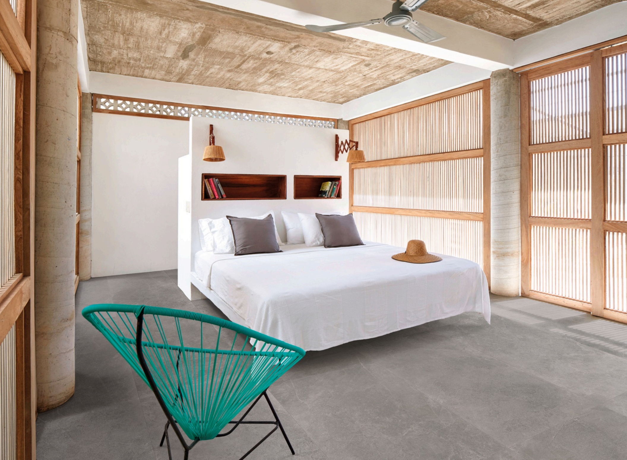
Realstone Slate Iron 75 × 150