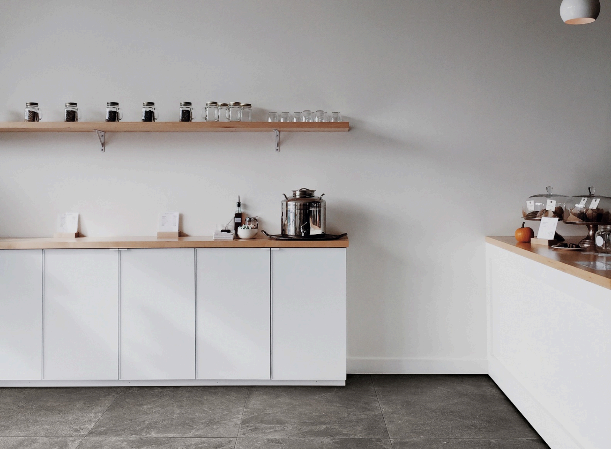
Realstone Slate Musk 75 × 150