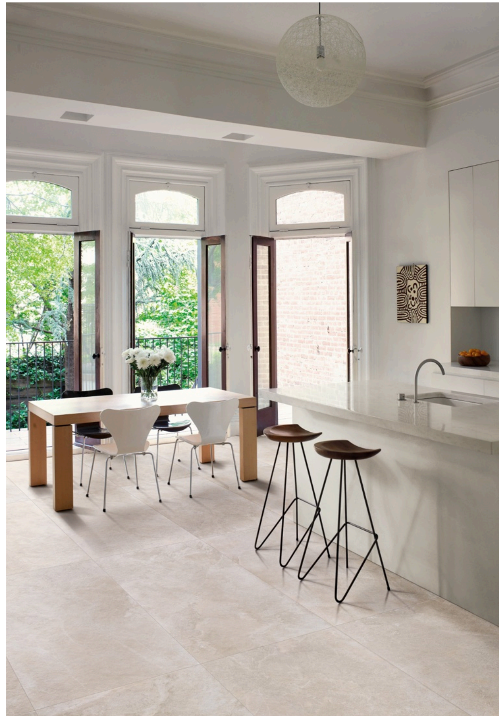
Realstone Slate Shell 75 × 150