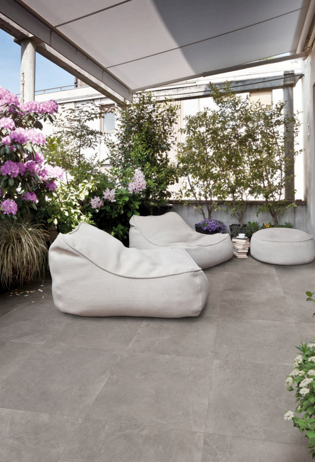
Realstone Slate Iron 75 × 150