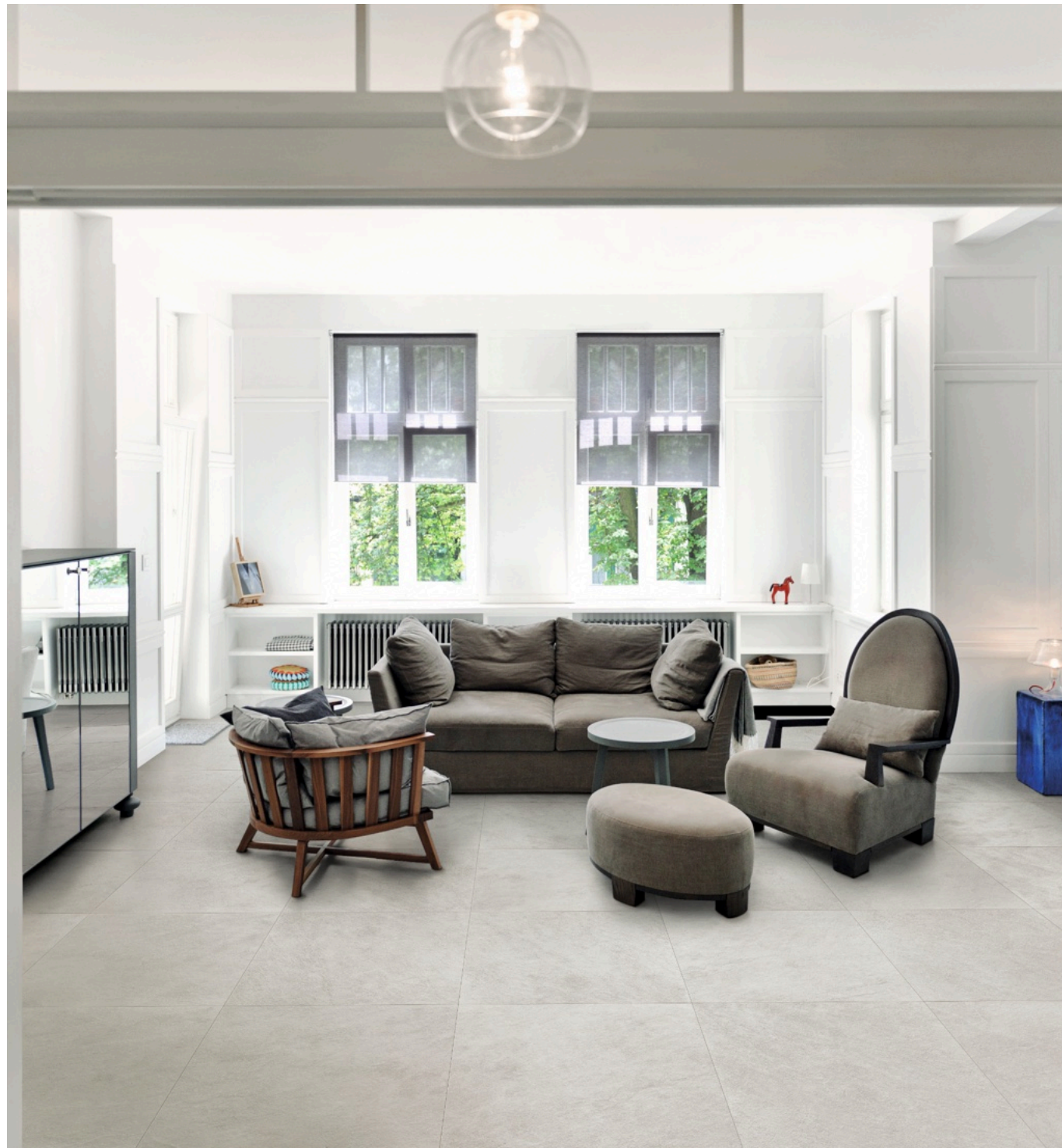
Realstone Slate Ice 75 × 150