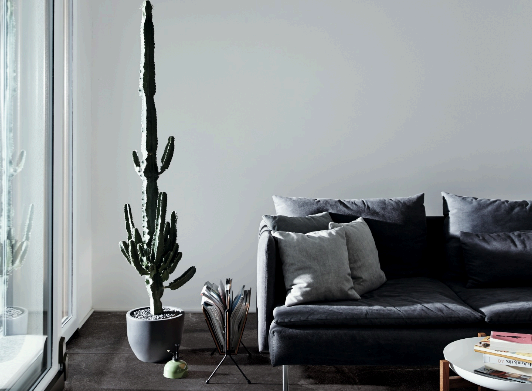
Realstone Slate Black 75 × 150