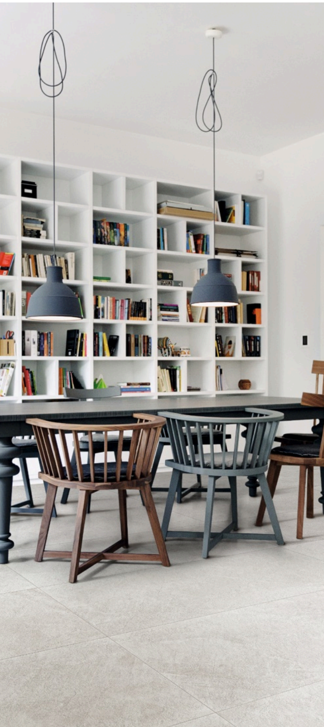
Realstone Slate Ice 75 × 150