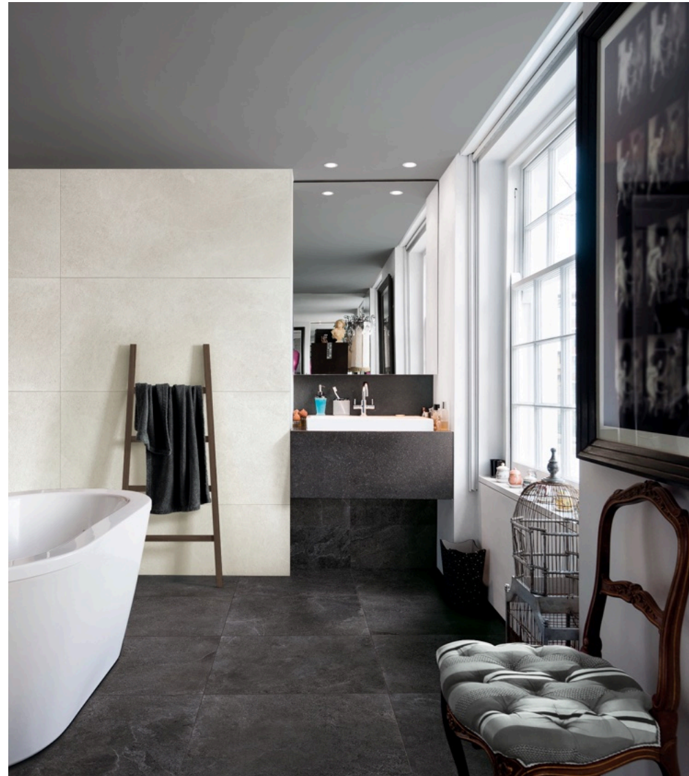
Realstone Slate Black 75 × 150