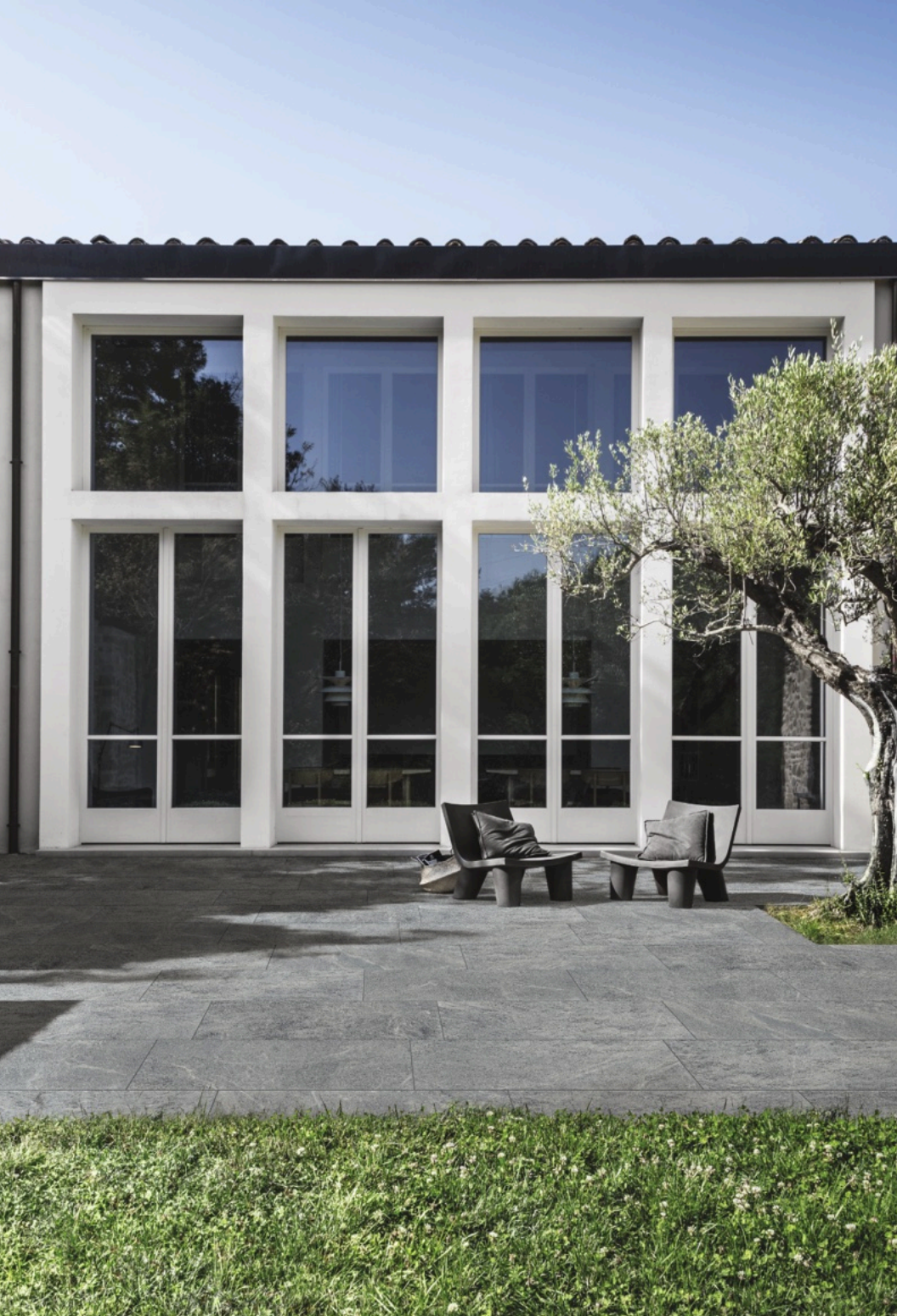
Quarzite Platinum 60 × 120