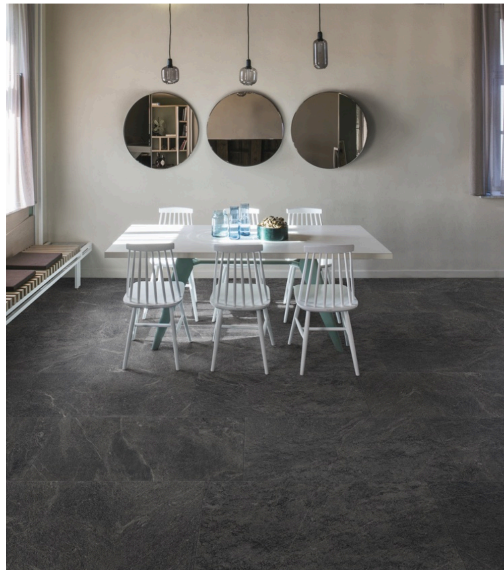
Quarzite Black 60 × 120