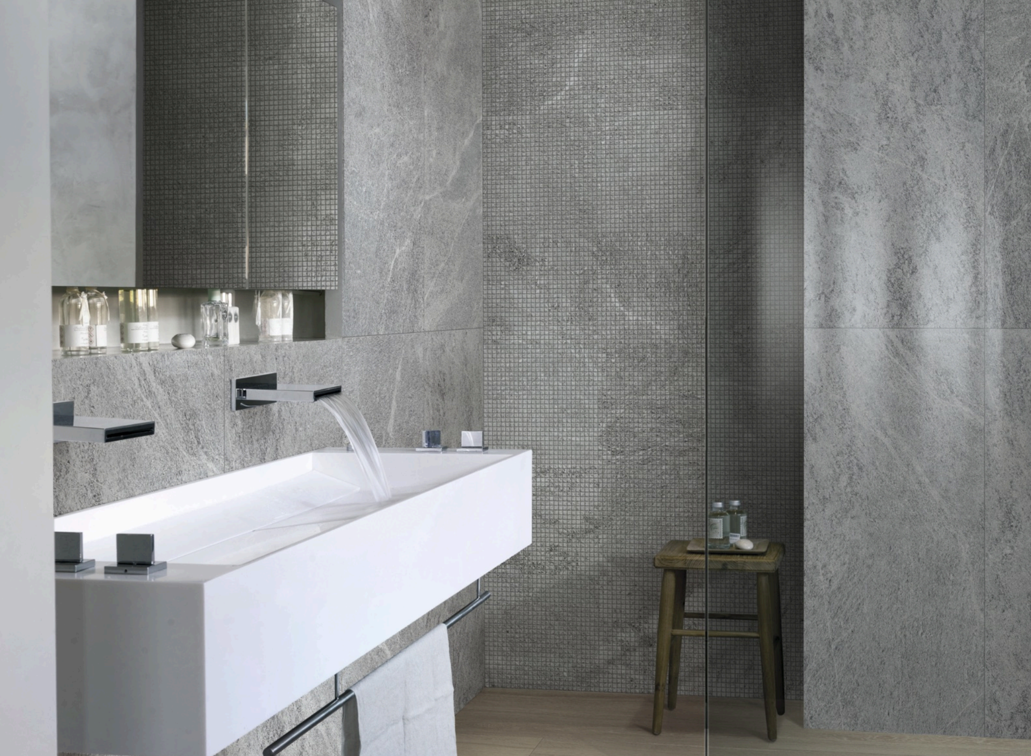
Quarzite Platinum 60 × 120