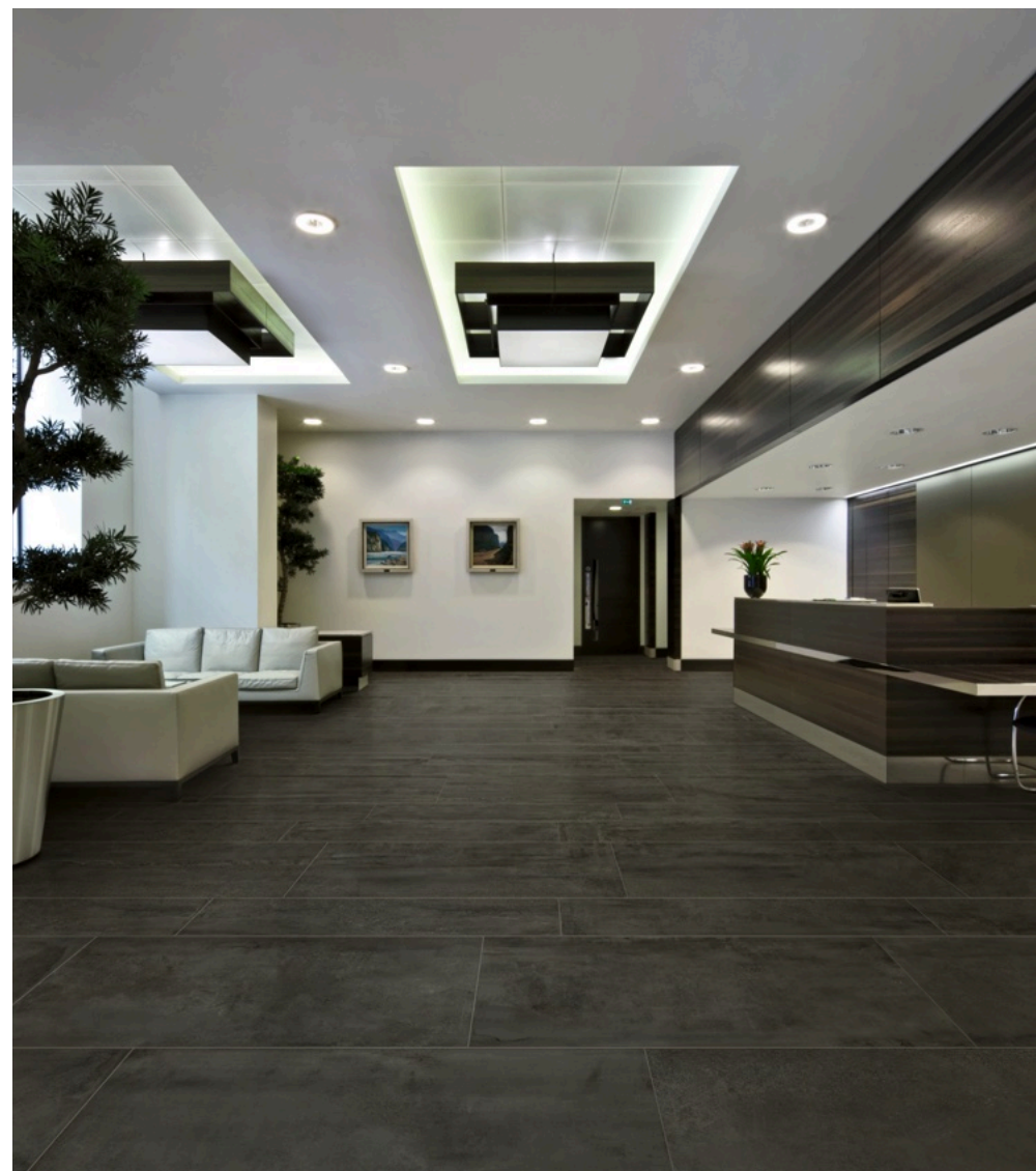
Prowalk Anthracite 75 × 150