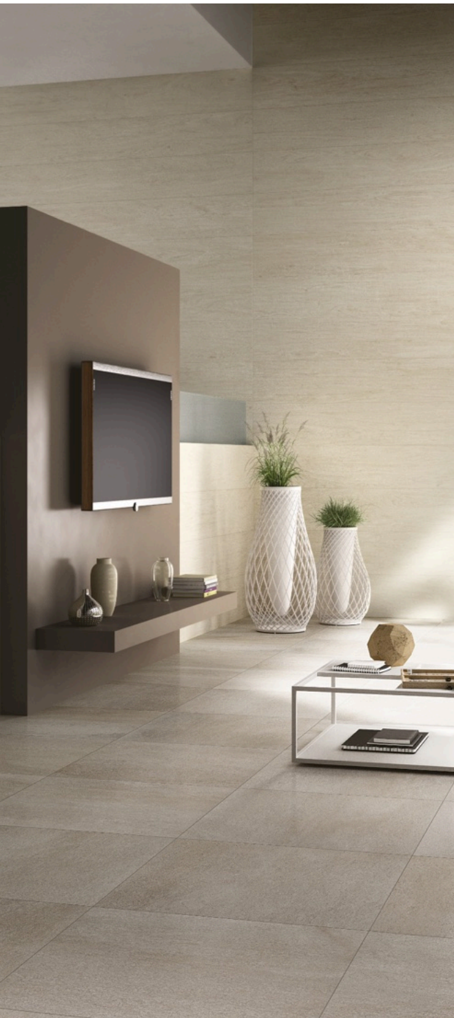
Forest Acero 33 × 300 (sobre pedido)