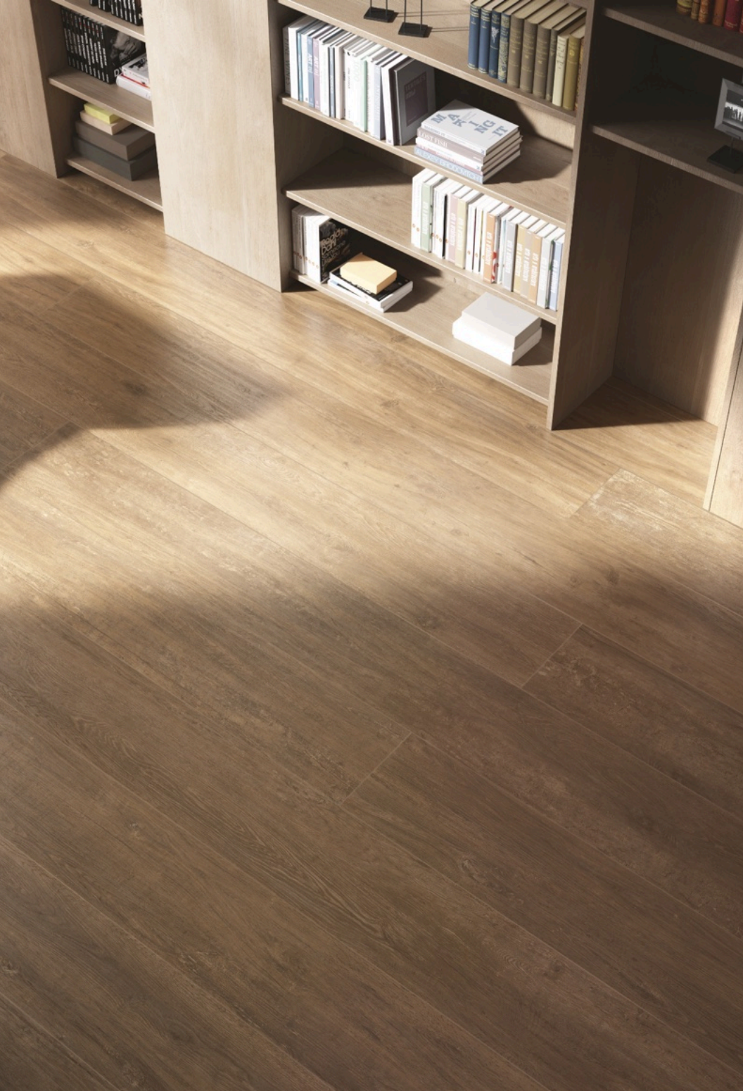
Forest Noce 33 × 30 (sobre pedido)