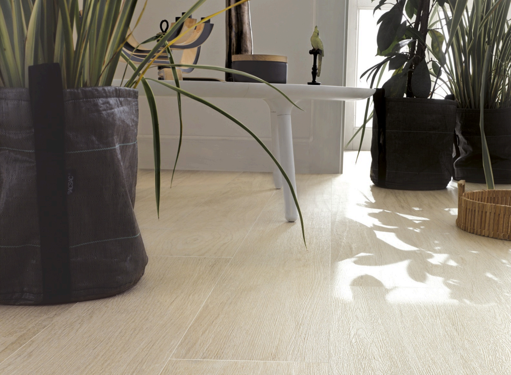
Forest Acero 33 × 300 (sobre pedido)