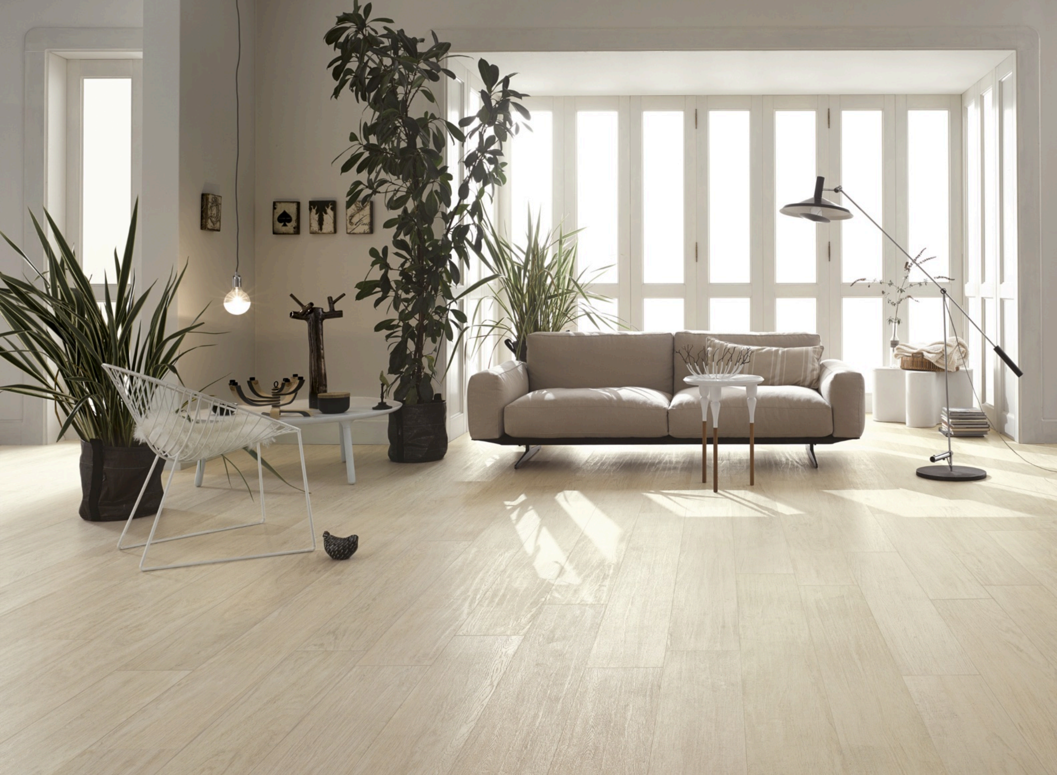
Forest Acero 33 × 300 (sobre pedido)