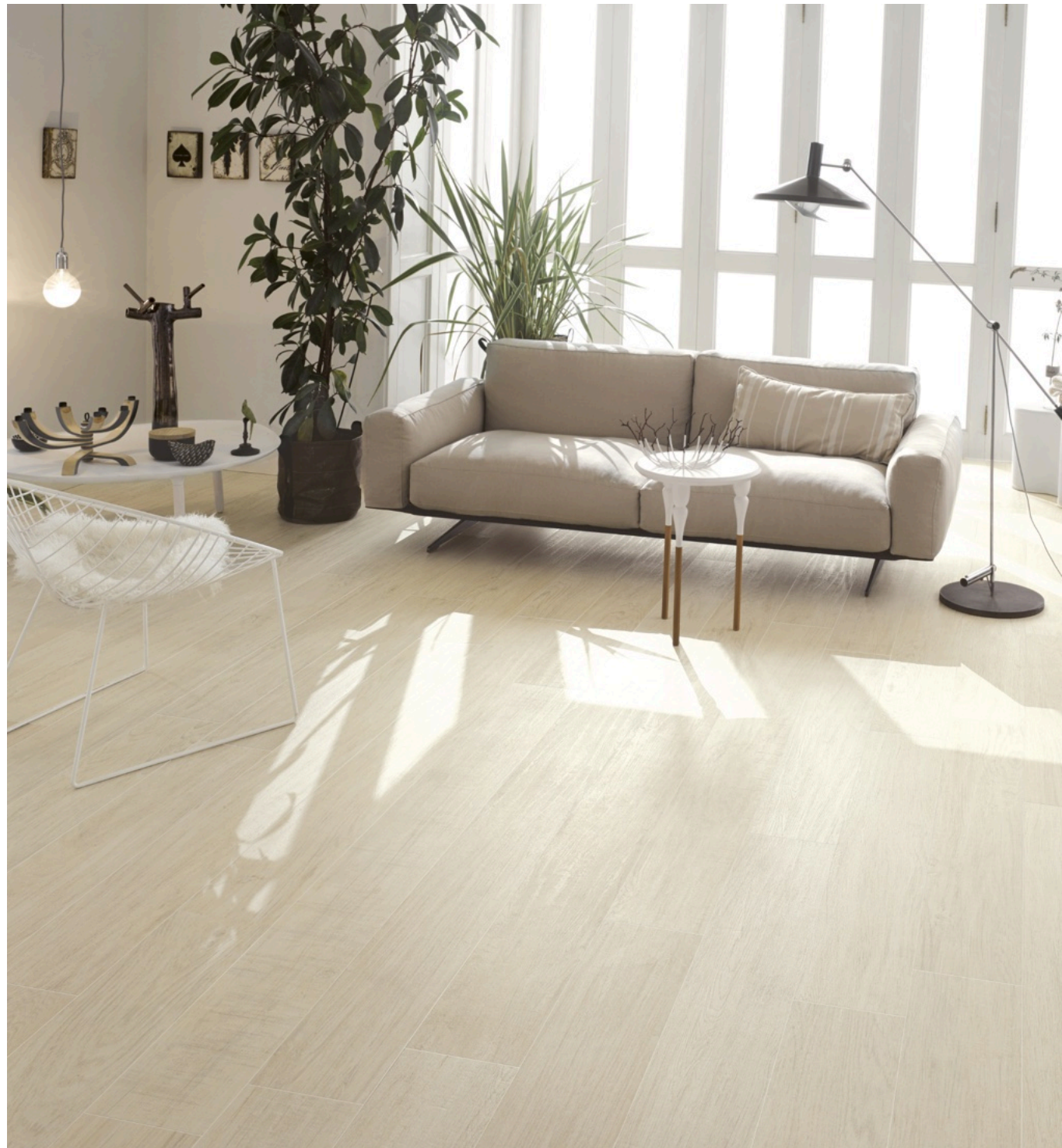
Forest Acero 33 × 300 (sobre pedido)