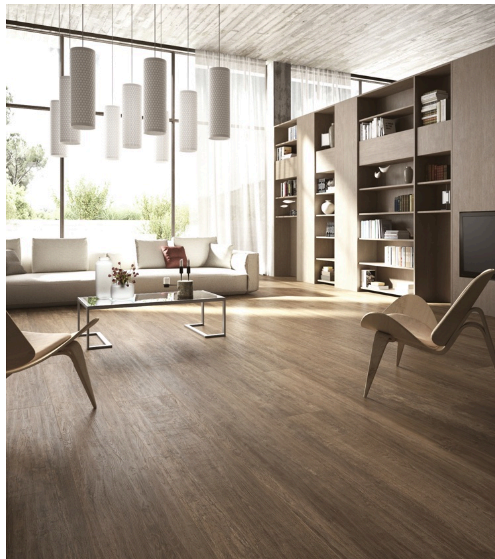
Forest Noce 33 × 30 (sobre pedido)